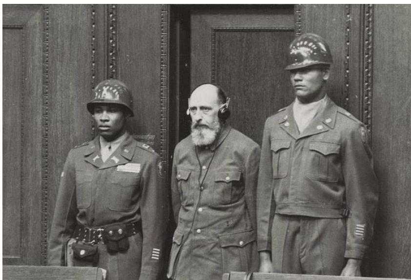
Пауль Блобель заслуховує вирок на Нюрнберзькому процесі, 1948 р.

Зокрема, він був звинувачений у вбивстві підрозділами під його командуванням 60 тисяч чоловік в період між червнем 1941 та січнем 1942 року. На свій захист, Блобель стверджував, що зондеркоманда 4а під його командуванням стратила не 60 000, а не більше 10 000-15 000 чоловік. Крім того, він заявив, що «страта агентів ворога, партизан-диверсантів, підозрілих у шпигунстві та саботажі, а також тих, хто шкодив