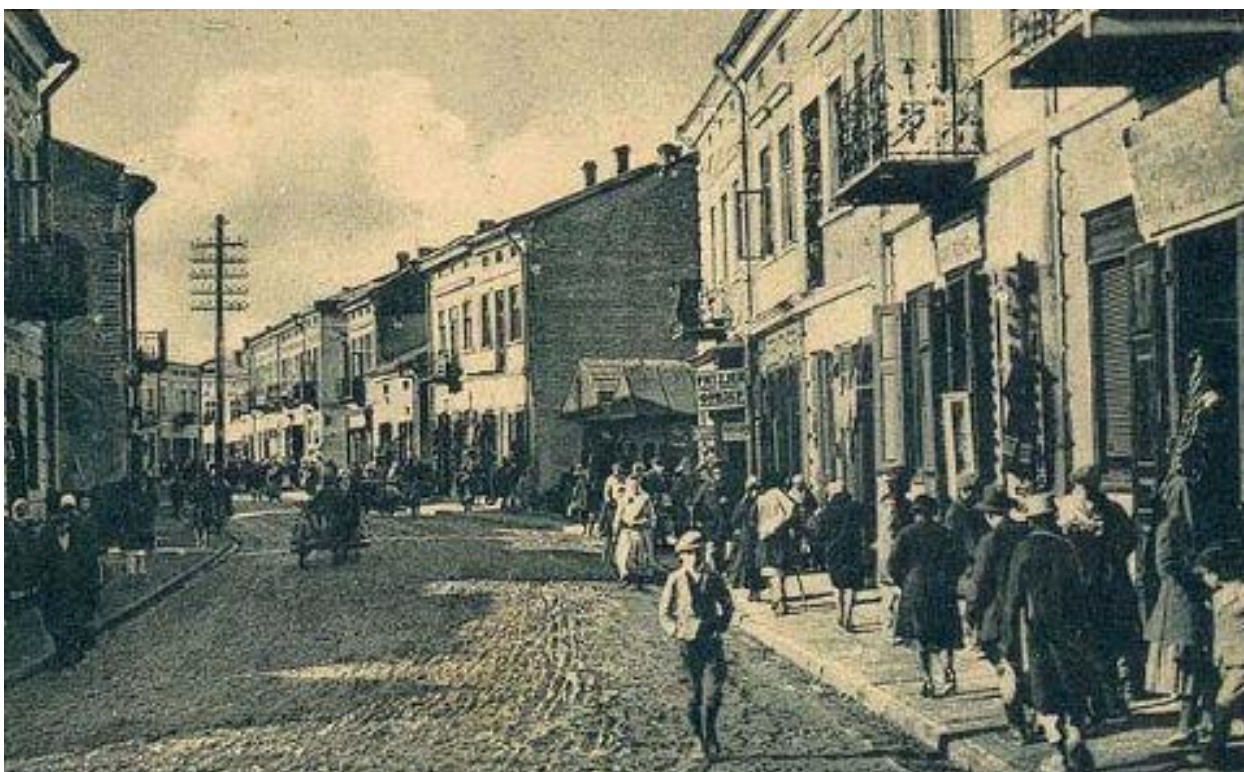
Турка, вул. Легіонів. 1923 р. 40

Місто Турка, що розташоване у мальовничому куточку Львівщини на лівому березі річки Стрий, у долині річок Яблунька та Літмир, є найменшим районним центром Львівщини. Проте це місто має поважну історію і привертає увагу своїми сакральними спорудами та особливим бойківським колоритом, яким сповнений кожен куточок Турки.