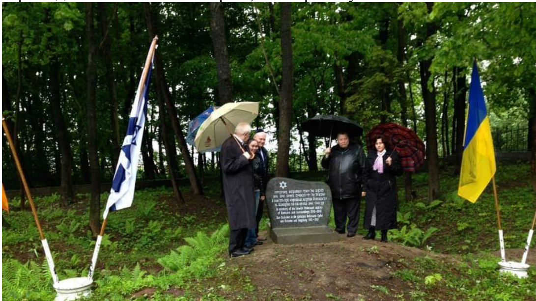
Відкриття пам'ятника на місці розстрілу євреїв біля м. Комарно, 2014. 19

7 липня 1944 року радянська армія вступила в Комарно. З кількох тисяч громади вижила лише 5 євреїв, які переховувалися.