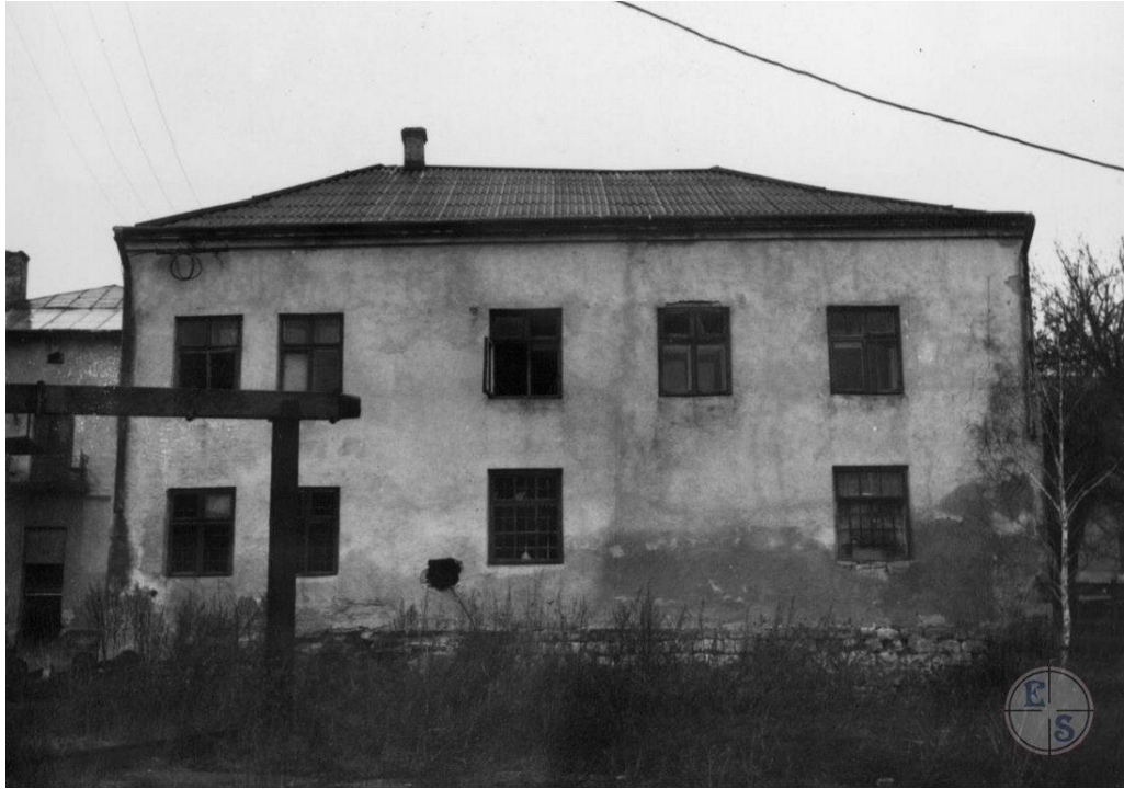
Синагога в Комарно, 1998 р. 17