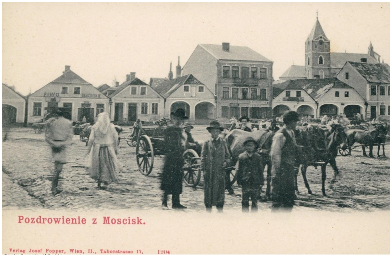
Мостиська, 1904 р. 21

Мостиська (пол. Mościska ) – місто, адміністративний центр Мостиської міської громади, Мостиського району, Львівської області, до 2020 р. районний центр колишнього Мостиського району. Розташоване на березі річки Січна в західній частині Сянсько-Дністровської вододільної рівнини за 14 км від кордону з Польщею. Через місто проходять важливі транспортні комунікації: міжнародний автошлях, територіальний автошлях, та залізниця Львів – Краків.