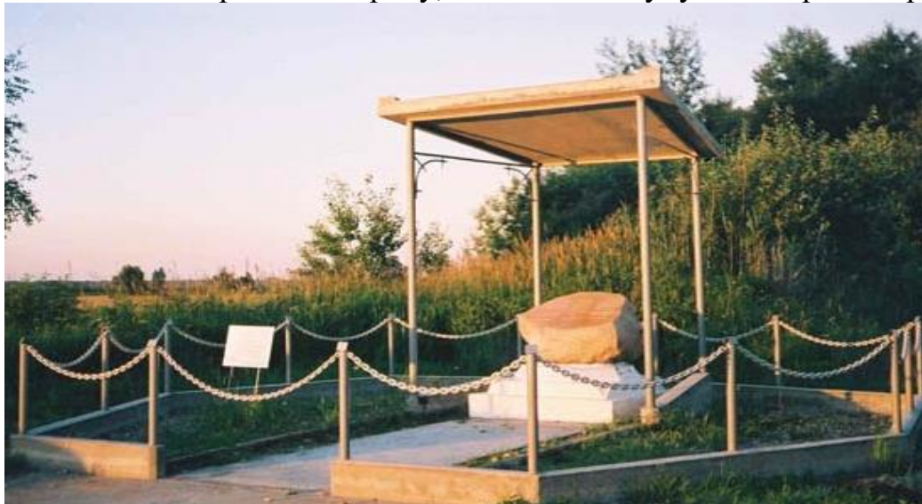
Меморіальний пам'ятник на місці розстрілу євреїв, 2006 р. 38 (Голоботівський ліс – неподалік від Стрия).

У лютому 1943 року німці розстріляли близько 2 тис. в'язнів гетто. У травні 1943 року на міському кладовищі – ще тисяча. У червні 1943 р. гетто було остаточно ліквідовано, будинки спалені, щоб не було можливості сховатися. Закриті в трудових таборах, вони були вбиті через місяць. У серпні 1943 року німецька влада оголосила Стрий «юденрейном» (хоча в наступні місяці тут неодноразово знаходили і розстрілювали євреїв). Лише одиниці дожили до серпня 1944 року, коли місто окупувала Червона армія.