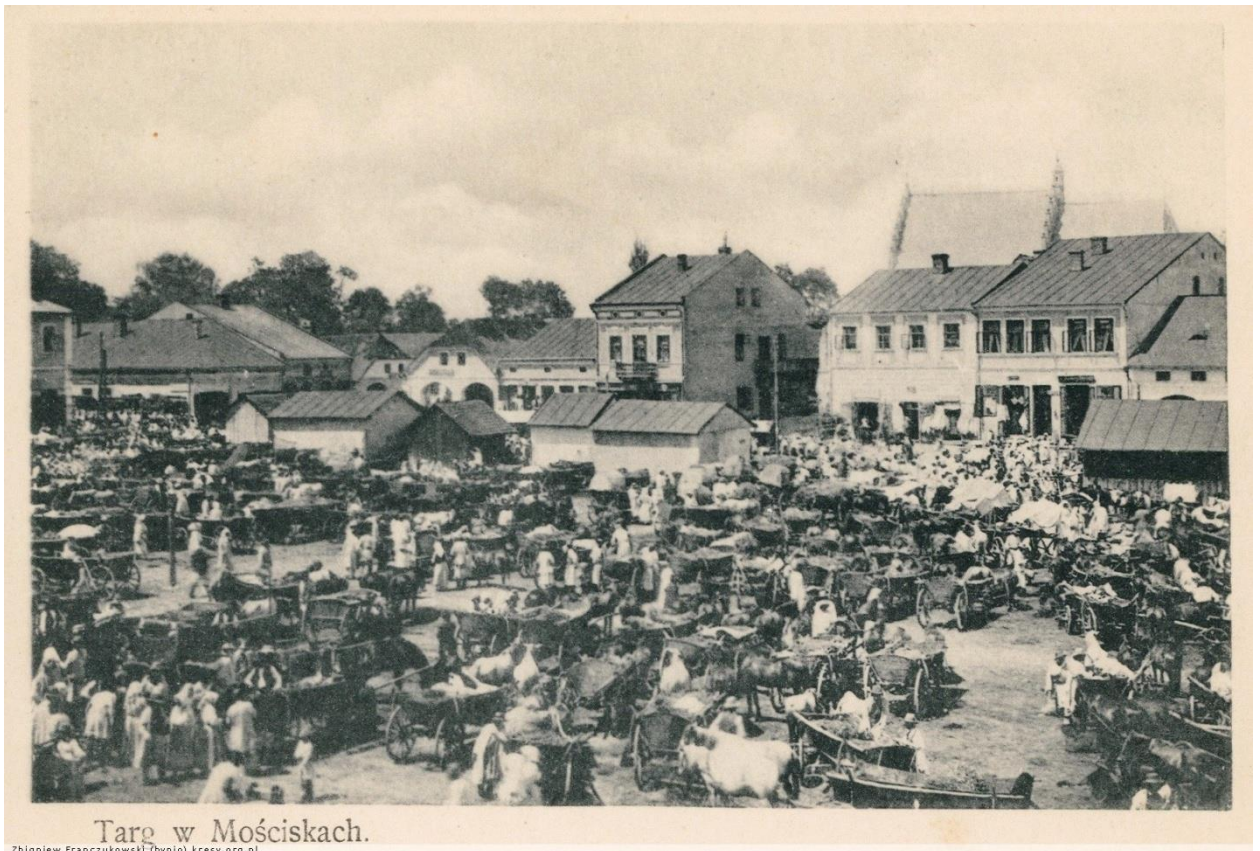
Торгівля на ринковій площі в Мостиську, 1906 р. 23

Мостища, в якій військо Данила Галицького розбило загони претендента на Галицький престол, Чернігівського князя Ростислава Михайловича . В часи Галицько-Волинського князівства містечко було значним торговельним і ремісничим центром.