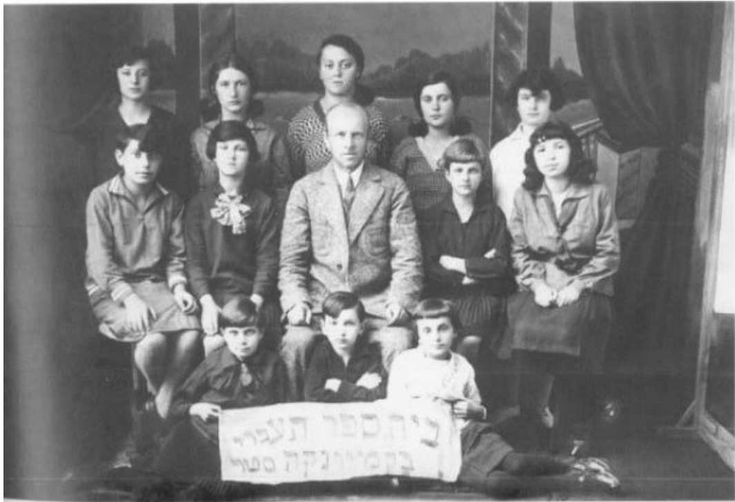
Кам'янка-Струмилова, учні початкової школи. 1930 р. 6