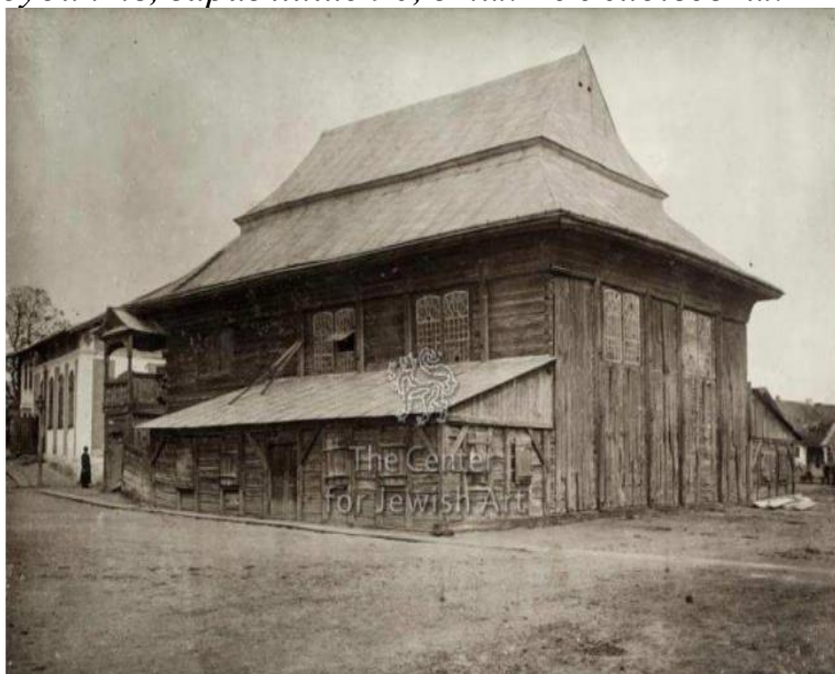
Синагога, 1920-1928 р.

Кам'янка Струмилова не раз була знищена разом зі своїми святинями, найбільше шведською війною 1655-1657 рр., так званим «потопом», після якої люстратор під роком 1662 відзначив, що «давніше в місті було 500 будинків, зараз лише 90, з них 16 жидівських 4 ». Місто тяжко відроджувалося.