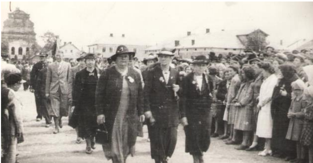
Комарно, 3 травня 1938 року. Святкова демонстрація. В перших рядах демонстрантів – польська інтелігенція.

Одержавши магдебурзьке право, Комарно залишалося порівняно невеликим містечком – в 1578 році проживало 435 чоловік, значну частину яких становили ремісники. В XVII столітті промисли почали бурхливо розвиватися: з'явилися млини, броварні, пасіки, хмелярні, у великих ставках вирощували рибу. Щороку в місті проводилися великі ярмарки, що свідчить про його розташування на важливих торговельних шляхах, які сполучали Україну з країнами Західної Європи.