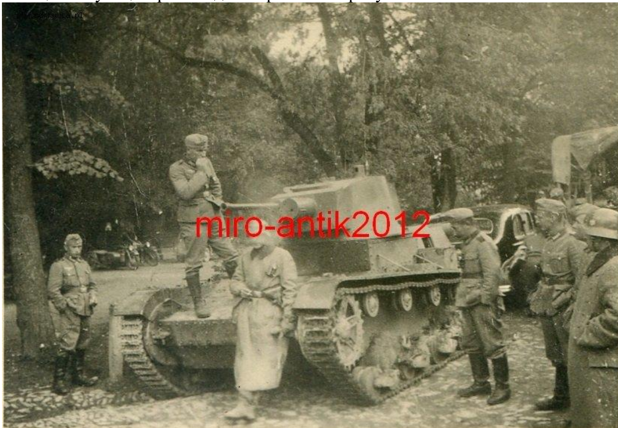
Стрий, німецькі солдати оглядають польський танк. Вересень, 1939 р.

За Пактом Молотова-Ріббентропа 1939 року Стрий анексований Радянським Союзом. З вересня 1939 по липень 1941 року місто перебувало під радянською владою. Радянська окупація у липні 1941 року знов змінюється нацистською. Війська вермахту зайняли місто 2 липня 1941 року. Німецька окупація тривала до 5 серпня 1944 року.