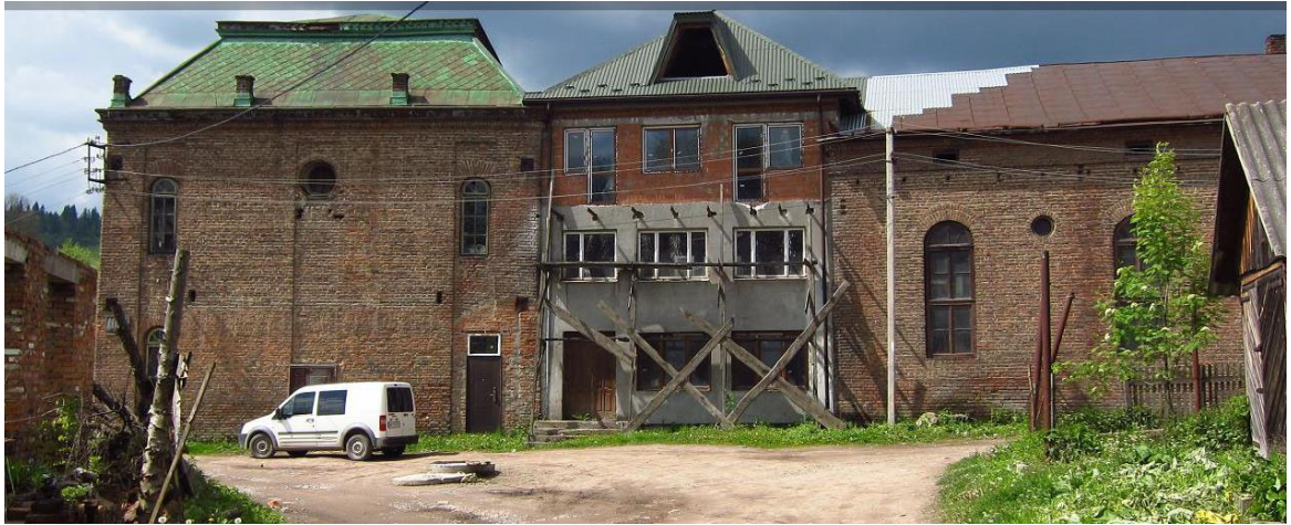
м. Турка, хоральна синагога. 2016 р. 46

Сумні події спіткали синагогу в 1942-1943 рр.: у всіх чотирьох частинах синагоги розмістилося єврейське гетто, там мордували місцевих євреїв і звідти їх відправляли на розстріл або в концтабори.