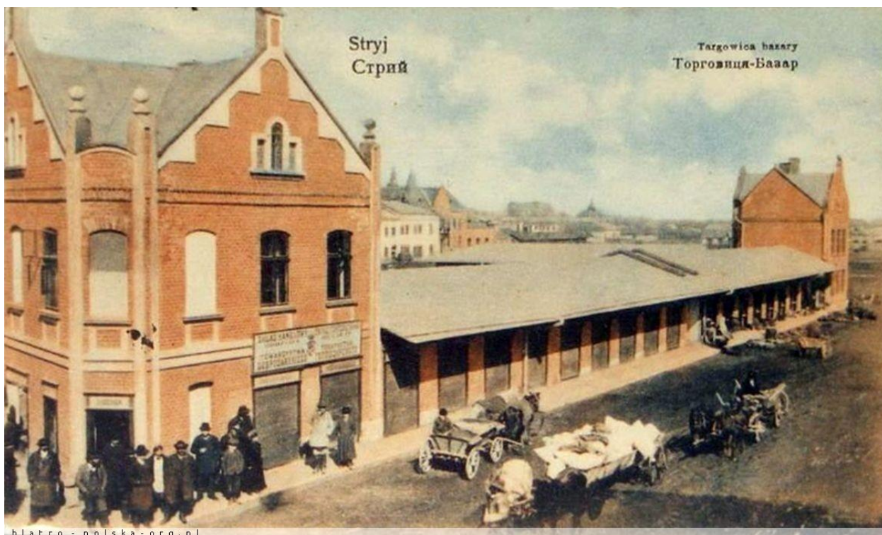
Торговиця в Стрию, 1915 р. 29

За даними 1811 року, тут діяли ремісничі майстерні (миловарні, сідельні), ткацька фабрика, водяні млини, пивоварні, чотири винокурні та цегельня.