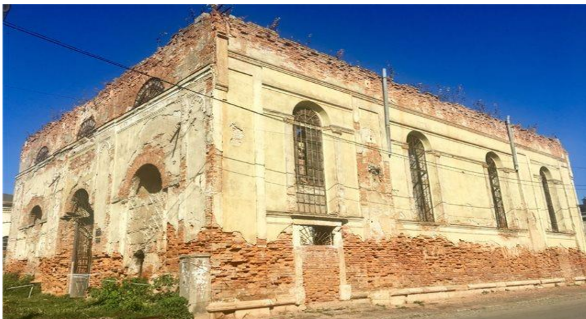
Залишки Великої синагоги, 2000 р. 36