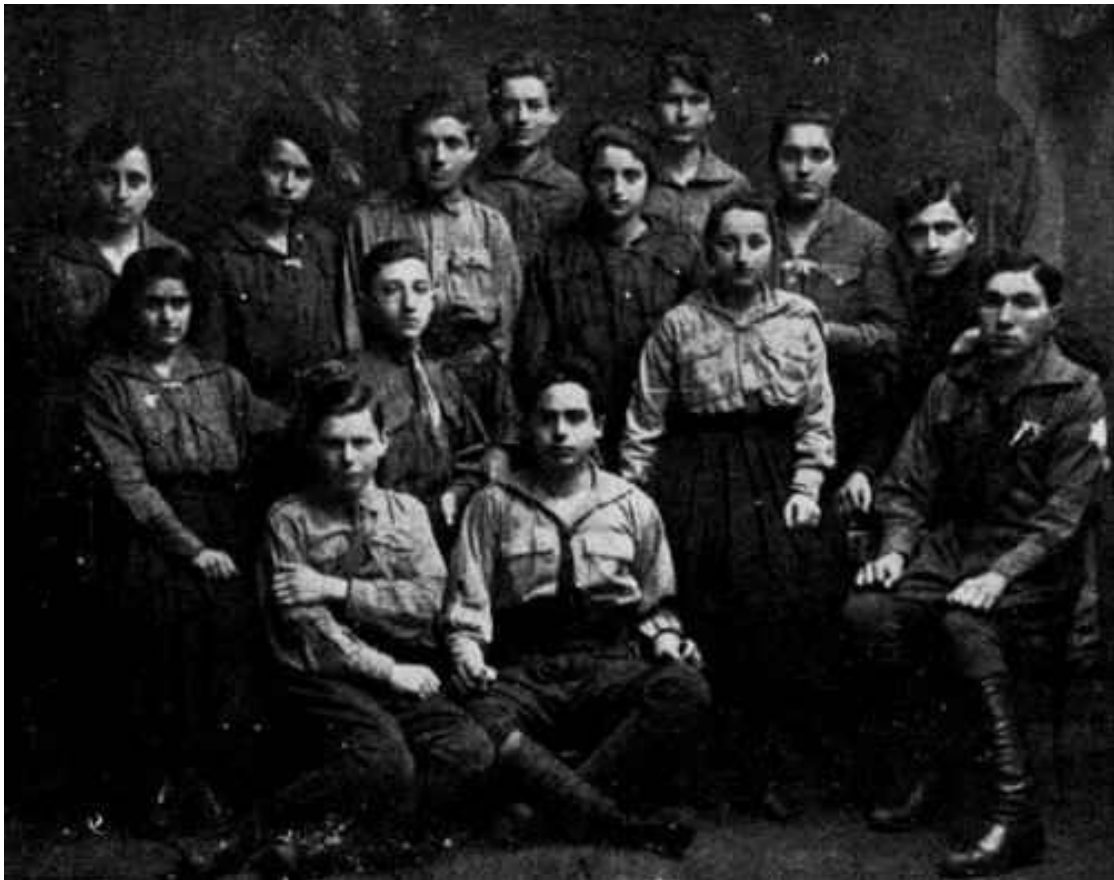
Лідери груп Хашомер Хацаір ( Hashomer Hatzair ) 32

1567 р. стрийська влада заборонила прибулим євреям селитися у місті, однак у місті уже мешкала чимала єврейська громада.