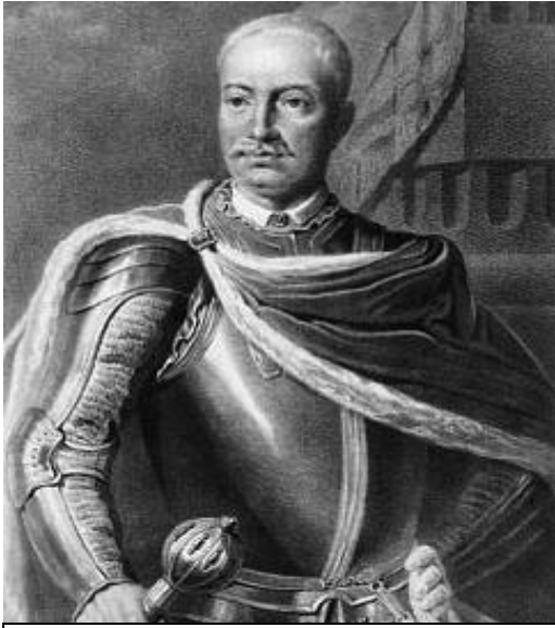
Фелікс Казимир Потоцький

Син Францішка Салезія Потоцького, Станіслав Щесний Потоцький, після трагедії з Гертрудою Коморовською, переніс родинну «столицю» Потоцьких з Кристинополя до Тульчина (1774).