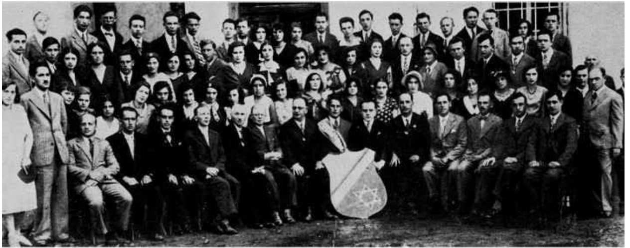
Активісти Поалей-Ціону, 1919 р. 33

гебрейської громади міста. Невдовзі Ян Собескі – онук Руського воєводи Івана Даниловича – став королем Речі Посполитої, який доволі прихильно ставився до євреїв.