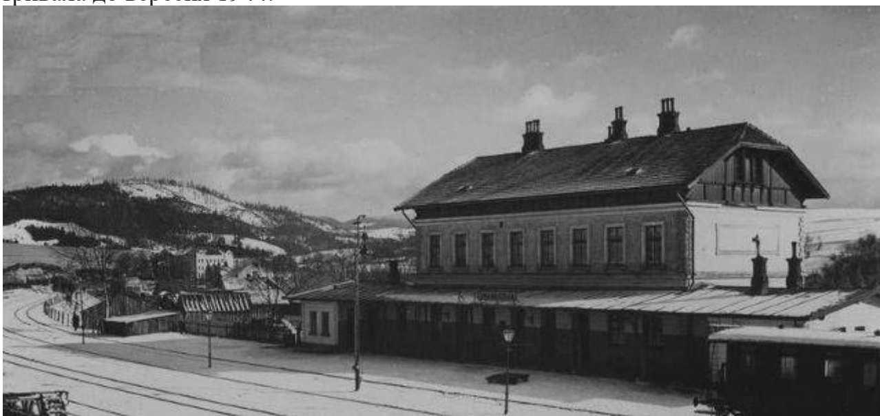
Турка, залізничний вокзал. 1914-1918 рр. 41

Після Першої світової Турка входить до складу II Речі Посполитої, а з 1939 відходить до УРСР. 1 серпня 1941 р. – початок німецької окупації, що тривала до вересня 1944.