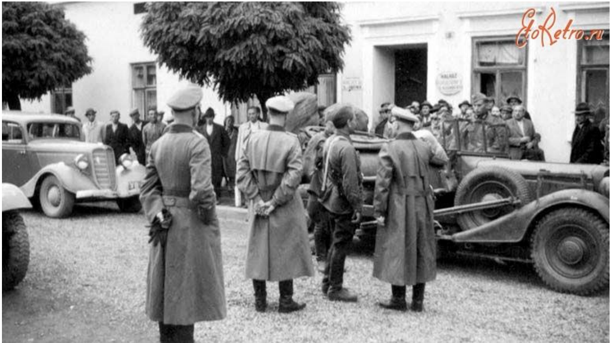
Стрий. Зустріч радянських та німецьких військ у вересні 1939 року. 30