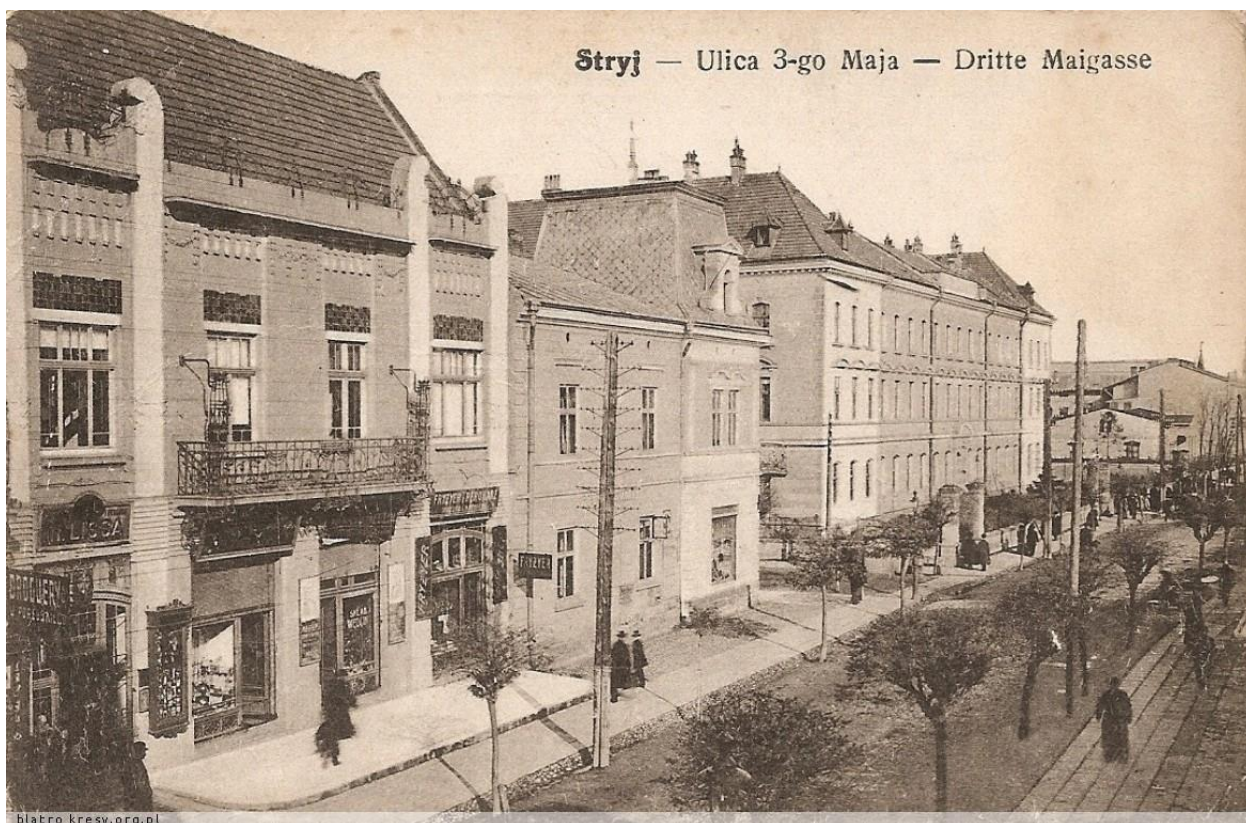
Стрий, вулиця 3-го Травня. 1918 р. 28

Точна дата заснування Стрия невідома. Археологічні розкопки свідчать, що село існувало вже за часів Київського та Галицько-Волинського князівств. Розвитку Стрия сприяло розташування на перехресті двох важливих доріг, одна з яких вела північними схилами Карпат, а друга вела в бік карпатських перевалів.