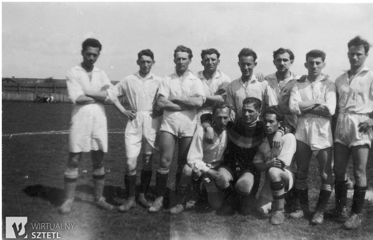
Єврейська футбольна команда «Jutrzenka». Мостиська, 1935 р. 25

Євреї оселилися в Мостиськах із середини XVI ст. Під час повстання Хмельницького 1648–1649 рр. місто було зруйноване, громада зазнала величезних втрат. Його реконструкція тривала десятиліттями. До кінця XIX століття світогляд формував переважно хасидизм, але з часом Гаскала та сіонізм все швидше набирали популярності.