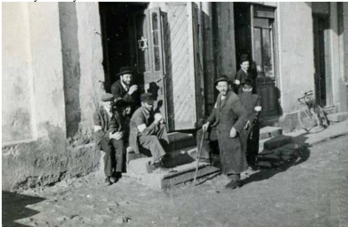
Євреї Комарно під час німецької окупації з пов'язками на руках 18

22 жовтня 1941 року в Комарно відбулися перші масові вбивства. Понад 200 осіб були заарештовані та ув'язнені в місцевій в'язниці. Наступного ранку поліція перевезла їх до сусіднього лісу, де їх розстріляли. Тіла кинули в яму і спалили.