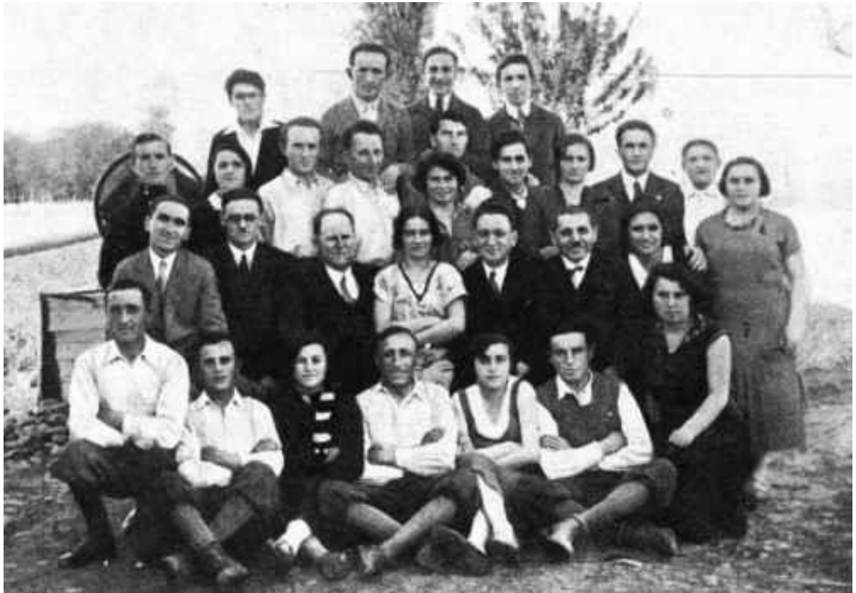
Активїсти з Ланна (Стрий) з керївництвом “Хїтагдут”