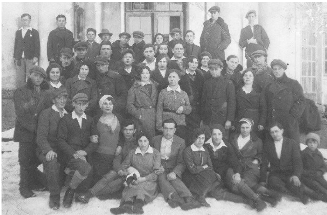
Єврейська молодь Кристинополя 30-ті роки ХХ-ст. 70

Початком вигнання євреїв із Кристинополя стала Друга світова війна. 1 вересня 1939 року гітлерівські війська перейшли польський кордон і почали окупувати Польщу. Подальші дані подаються спогадами колишніх жителів міста. «У вересні 1939 року, коли німці були під Львовом, із Белза приїхала легкова машина (у Белзі був головний галицький рабін) сильно сигналіла в місті і зібрався мітинг жидів. Приїхало двоє жидів. Один із них виліз на машину і об'явив, що на річках Буг і Солокії буде границя і хто хоче, щоб виселилися за цей кордон ще до вечора. Жиди виїхали до вечора, хто чим міг: фірами, тачками. В місті залишилось кілька старих людей» 69 .