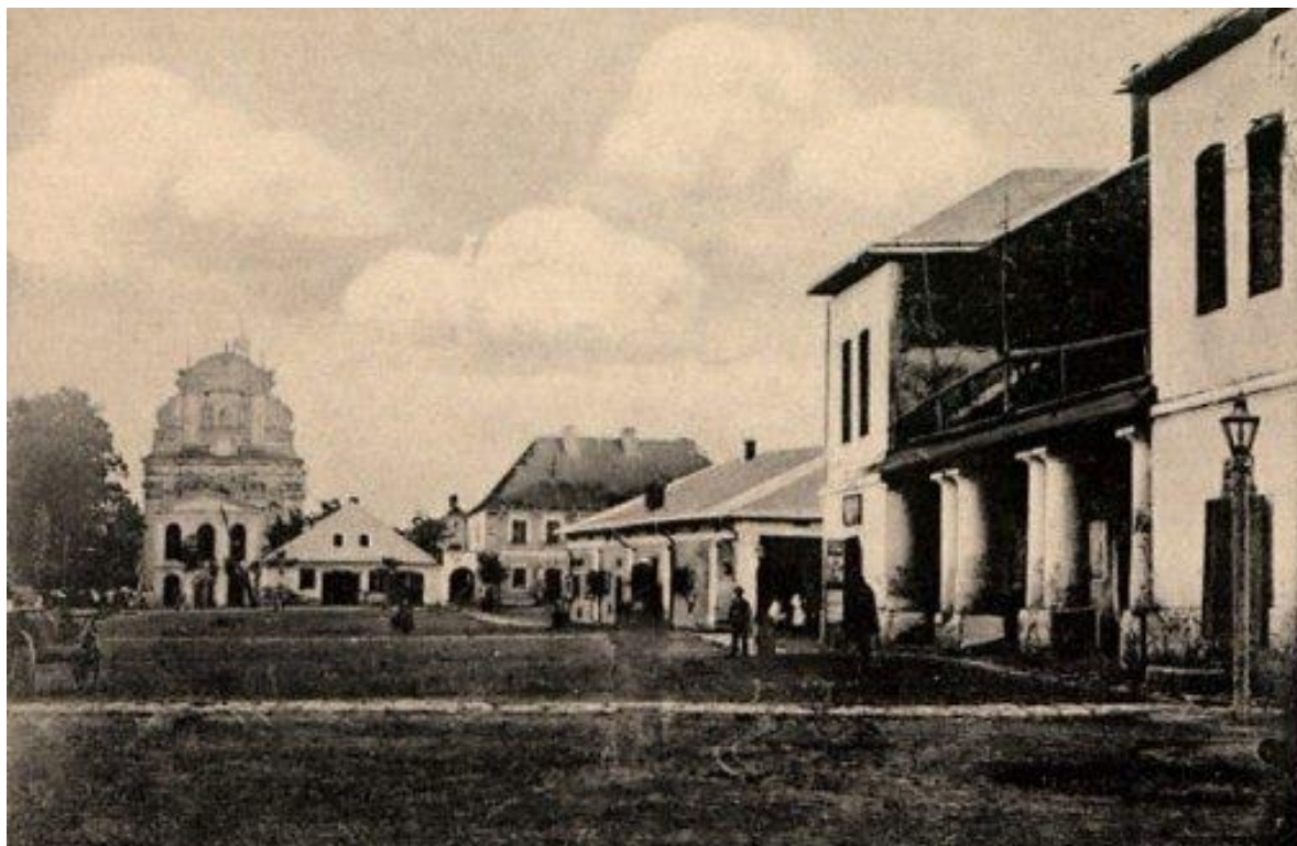
Ринок в Комарно 12

Комарно (до 1992 року – Комарне ) – місто Львівського району (до 2020 року – Городоцького району) Львівської області. Центр Комарнівської міської громади. Розташоване в південно-західній частині Львівської області в Городоцько-Комарнівській увалистій рівнині на березі річки Верещиця (притоки Дністра).