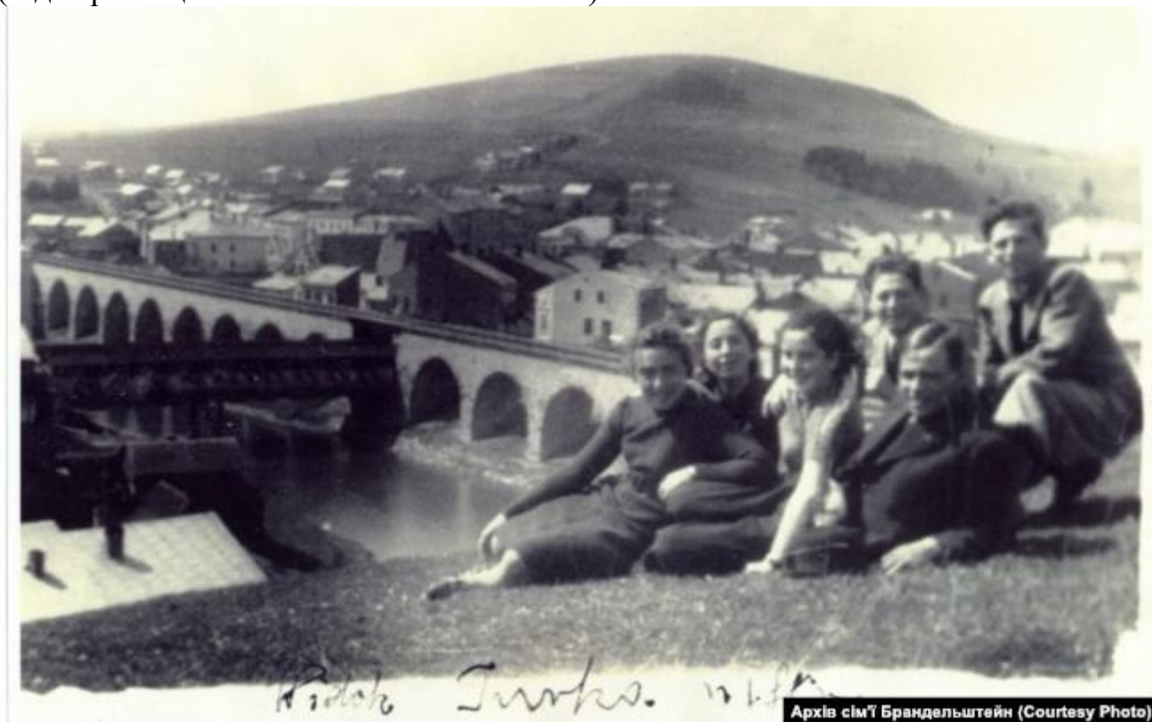
Єврейська молодь Турки, 1939 рік. 44