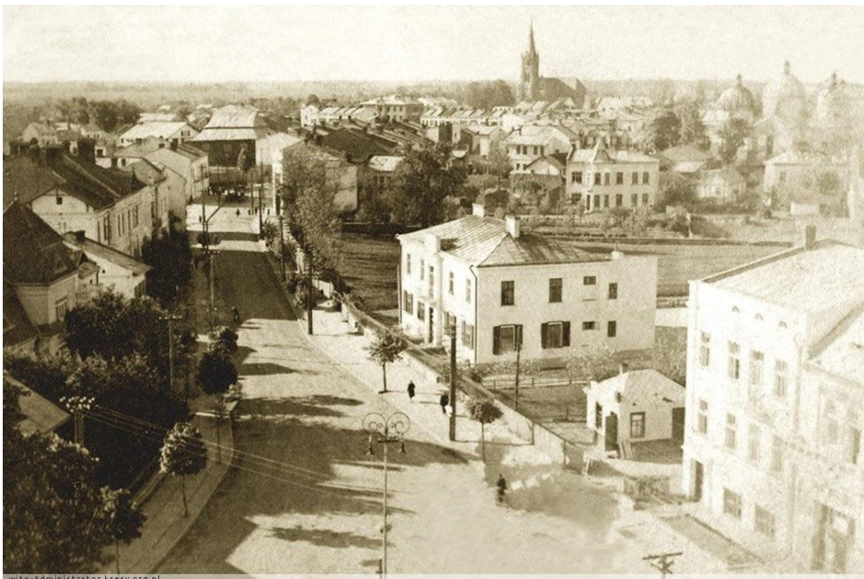
Панорама міста. Вид з вежі ратуші, 1930-ті роки. В кінці вулиці дерев'яна синагога (згоріла під час Другої світової війни). 2