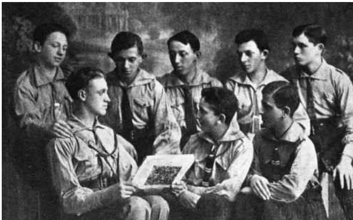
“Nahalutz Hatzair” group Група «Хахалуц Хацайр».