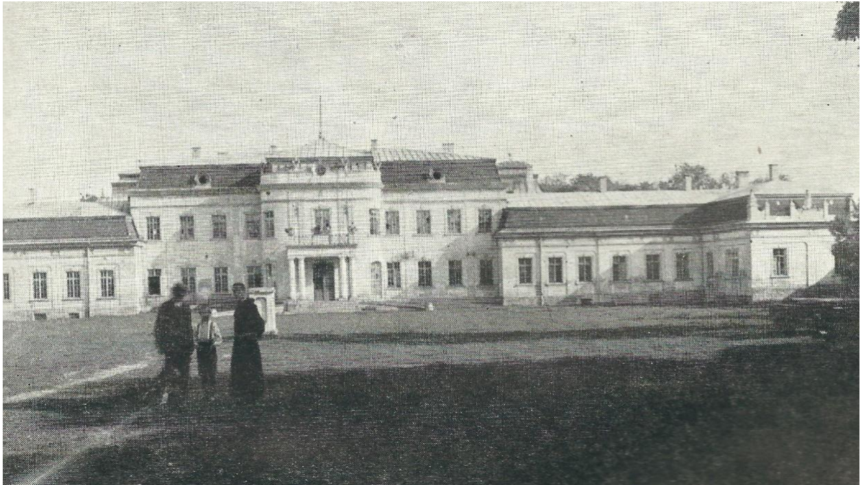
Палац Потоцьких, 1925 р. 58

базованого на «Талмуді» роману Yad ha Me'ir , в історії міста – як основоположник династії, члени якої мають прізвище на честь Кристинополя» 57 .