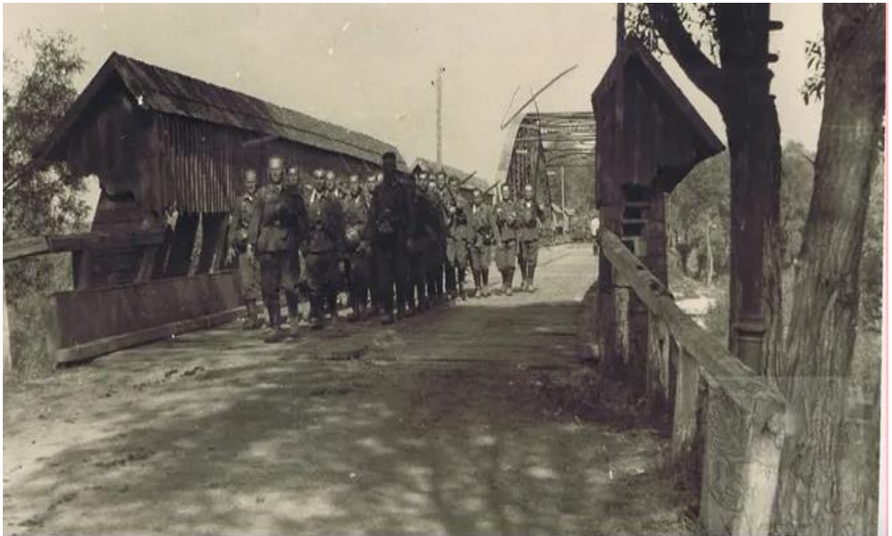
Німецькі війська у Кристинополі, 1941 р. 74

«Будівельник». А в 1939 році, як німці були в Кристинополі, то жидів не стріляли, а відправляли їх на радянську територію)» 73 .