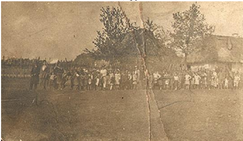
Єврейська школа у Кристинополі. Лаг ба-Омерська процесія. 1914 рік. 65

Монументальна класицистична божниця стояла поряд з бетмідрашем. Масивну кубічну брилу молитовної зали увінчував багатопрофільований карниз, над яким здіймався чотирихилий бляшаний дах. Стіни членувалися лопатками на три поля з великим півциркульним віконним прорізом і круглою нішею в кожному. Центральне поле східного фасаду мало кругле вікно для освітлення ніші Тори. Синагогальні приміщення прилягали до основної молитовної зали з двох боків. Головний вхід підкреслював портик з трикутним класицистичним фронтоном. Про інтер'єр відомостей не віднайдено. Божницю знищено під час Другої світової війни.