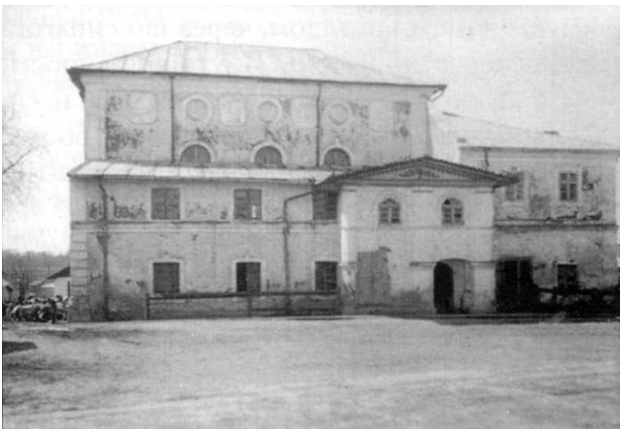
Червоноград (Христинопіль). Синагога мурована, 1920-і рр.