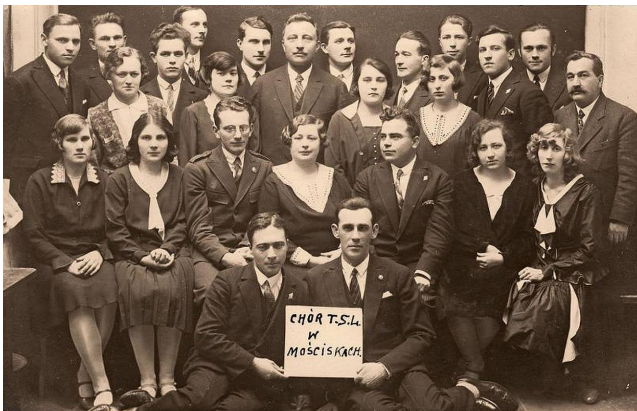
Хор Товариства народної школи в Мостиська

В цей період було створено відносно сприятливі умови для розвитку освіти і шкільництва. У кінці XIX — на початку XX ст. шириться діяльність Української Національно-Демократичної Партії, завдяки якій в Мостиськах було утворено ряд українських організацій: кредитна спілка «Народний дім в Мостиськах», філії товариств: «Просвіта», «Сільський Господар».