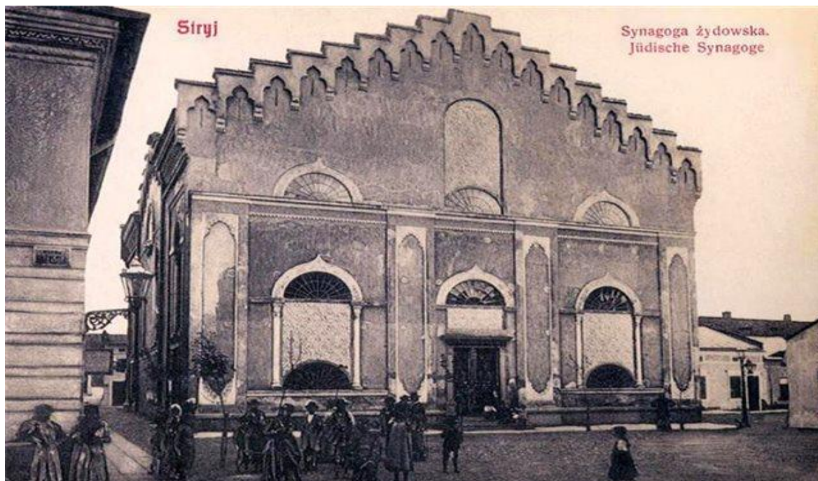
Велика синагога в Стрию. Початок ХХ-ст.

За радянських часів споруду використовувано як склад. У другій половині 1980-х років склепіння розібрали під час пристосування на басейн, проте за браком коштів будівельні роботи невдовзі спинилися. Дотепер збереглися тільки стіни