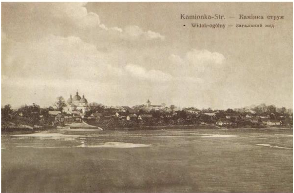
Кам'янка-Струмилова, 1914 р.

У XVI-XVII ст. із Кам'яниччини вивозили за кордон волів. Вивіз худоби – одна із найприбутковіших галузей польської шляхти. Селяни Кам'янка-Струмилівського староства 1636 року відмовились відбувати панщину. Особливо ж гостра боротьба проти соціального і національного гніту розгорталася в 1648-1657 роках. Тоді місто було зруйноване, населення пограбоване.