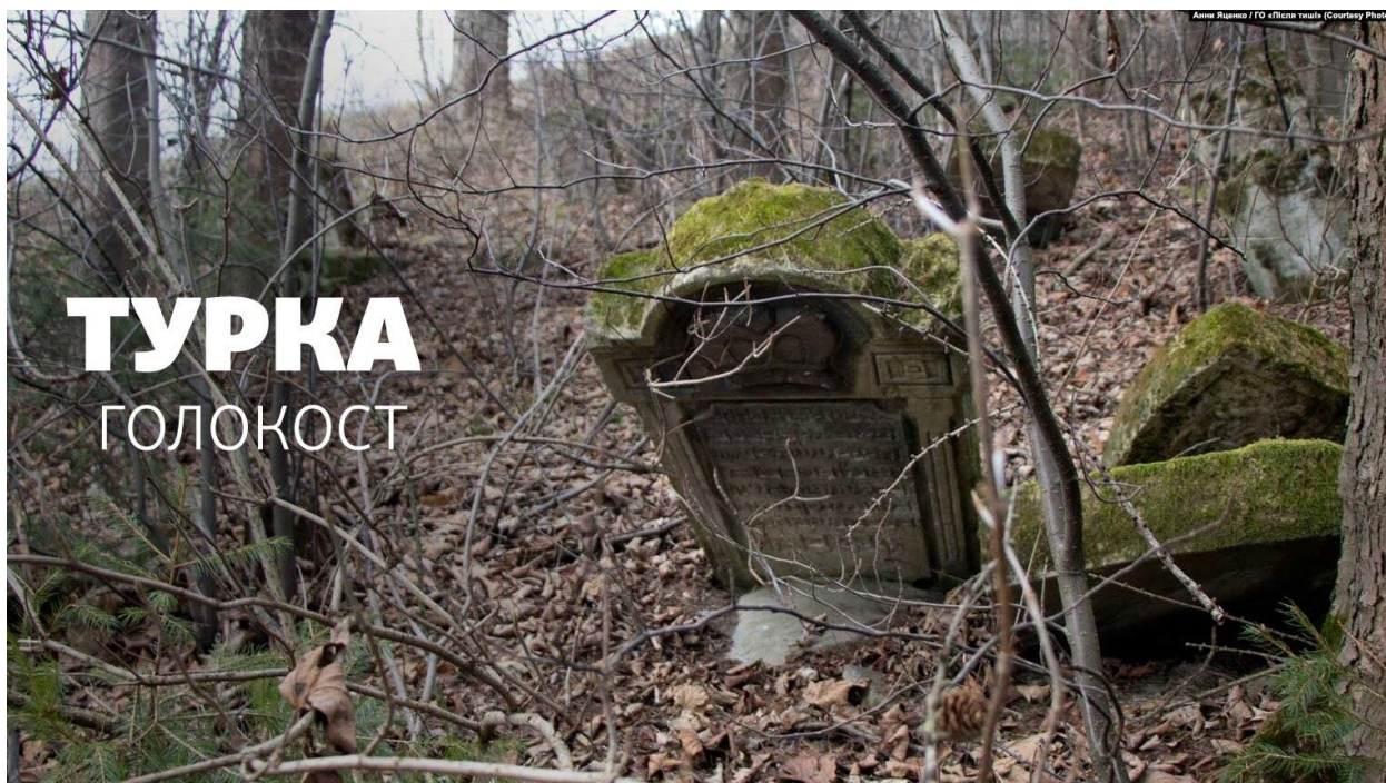
Єврейський цвинтар у Турці – одне із місць масових розстрілів місцевих євреїв. 48

Некрополь розташований на схилі гори, яка височіє над Площею Ринок, історичним центром міста безпосередньо біля базару. Їх розділяє річка Яблунька і невеликий підйом. З вершини гори, на якій розташована центральна частина єврейського кладовища, відкривається вражаюча панорама міста і його околиць. Місце розташування окопища в Турці вибрано у повній відповідності до єврейської традиції: річка була символічною межею між Царством мертвих і живих, а підйом вгору утруднював рух людини в інший світ, до смерті. Особливістю Турки є те, що усі міські цвинтарі – спільне українське та польське, як і єврейське – розміщені поруч.