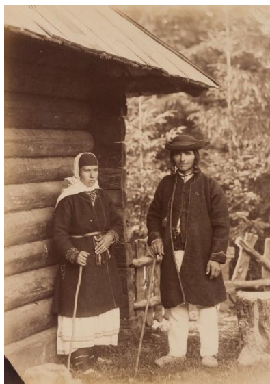
Народний одяг з гміни Беньова Турківського повіту. 1887 р. 42

Турку називають неофіційною столицею Бойківщини, адже саме на берегах місцевих річок Стрий, Літмир та Яблулька селилися перші представники цього племені.