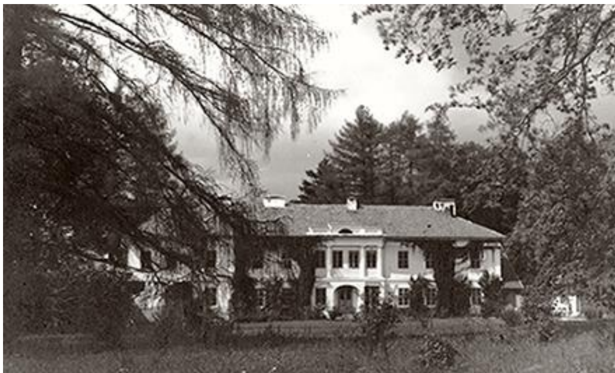
Палац Лянцкоронських в Комарно. Вигляд до 1939 року.

Наступні привілеї місту надали королі: Сигізмунд I (поч. XVI ст.) та його син Зигмунт Август, а в 1767 р. Станіслав Август Понятовський. У місті розвивалися торгівля (через Комарно проходила т.зв. перехресна дорога, якою мандрували купці; ярмарки відбувалися по понеділках) і ткацтво, шевство та гончарство; діяла суконна фабрика.